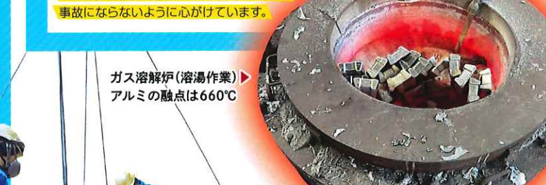
ガス溶解炉(溶湯作業) ▶ アルミの融点は660℃

Q.お仕事について詳しく教えてください アルミ製品の製造を行っています。砂で型を造るところから型の中に注湯するとこまでが私の仕事です。この後型枠の解体、仕上げは仕上りの仕事となります。アルミを高温で溶かすため、非常に熱く夏場は特に大変です。 Q.入社してよかったことや学んだことを教えてください 鋳造に関する技術と知識を学べたことです。特にアルミの鋳造を行う会社は日本でも数少ないため他では学べない知識が身に付きます。 Q.仕事をやる上で心がけていることはありますか? 700度の溶湯を使用しているため、火傷や事故にならないよう心がけています。