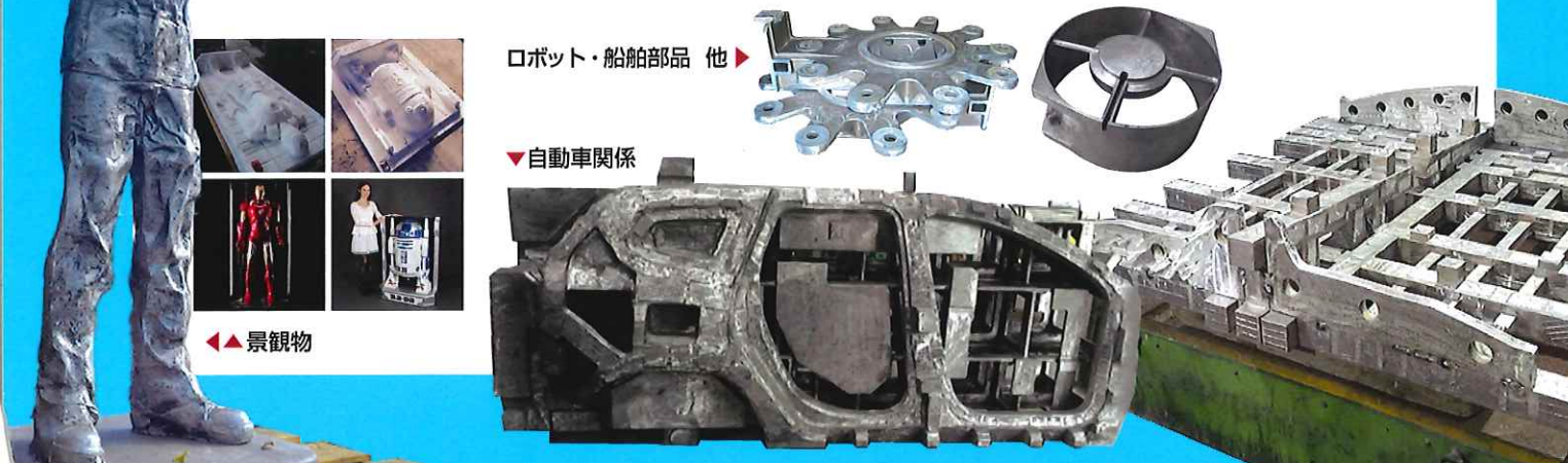
ロボット・船舶部品 他

性格 明るくて素直 趣味 映画鑑賞、バイク、ゲーム 出身高校 群馬県立板倉高等学校